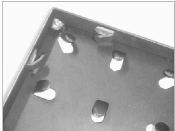
Garras para Fixação no concreto